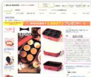
千趣会様 商品コピー制作