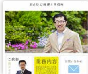
税理士事務所等、 士業全般のホームページ