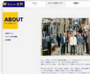
ショップのホームページ