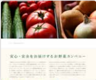
企業のホームページ