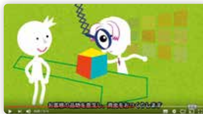
CM用ナレーション制作