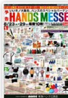
チラシ用コピー制作