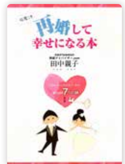
婚活本の編集協力