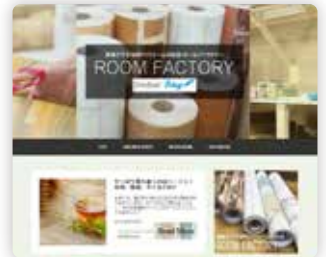
ECサイト用コピー、 コラム、メールマガジン