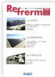
大阪ガス様 取材、原稿制作